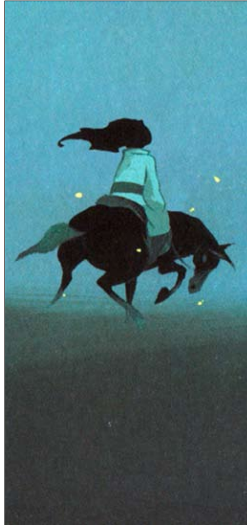
Hans Bacher, «Mulan», 1994