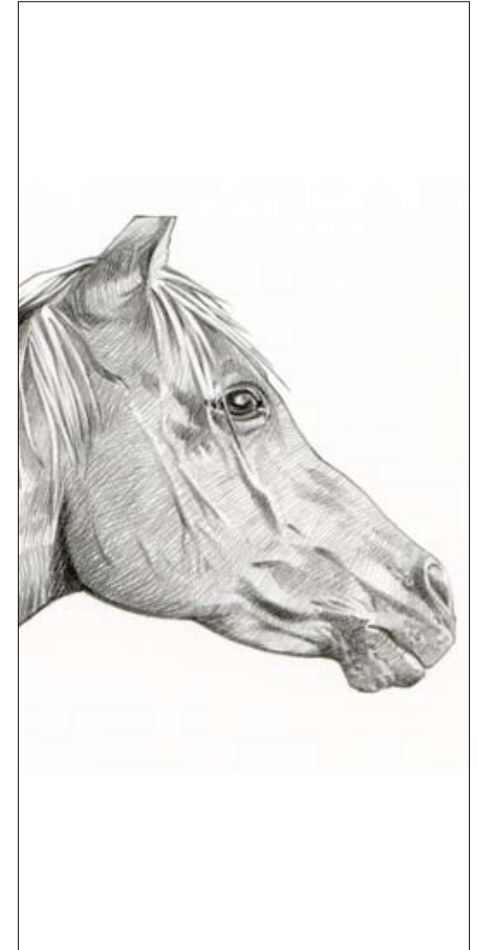
Simon Müller, Studie, 2008